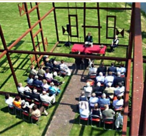
Museum Het Tramstation